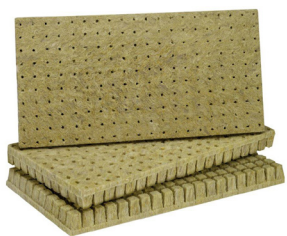
Paluszki AO Plug 25/40 -25*25*40 mm