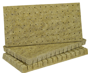
Paluszki AO Plug 36/40- 36*36*40mm

Paluszki firmy Grodan charakteryzują się niezwykle jednorodną strukturą i sztywnością włókien. Dzięki temu gwarantują skuteczne rozpraszanie wody i składników odżywczych. Ponadto sprzyjają szybkiemu, równomiernemu kiełkowaniu i ukorzenianiu się roślin. Zastosowanie tych wysokiej jakości paluszków pozwala na maksymalne zmniejszenie różnic w obrębie danej partii roślin i pomiędzy poszczególnymi partiami. Bardziej wyrównane siewki ograniczają konieczność sortowania podczas przesadzania i przyspieszają rozwój roślin, skracając tym samym czas oczekiwania na zbiory.